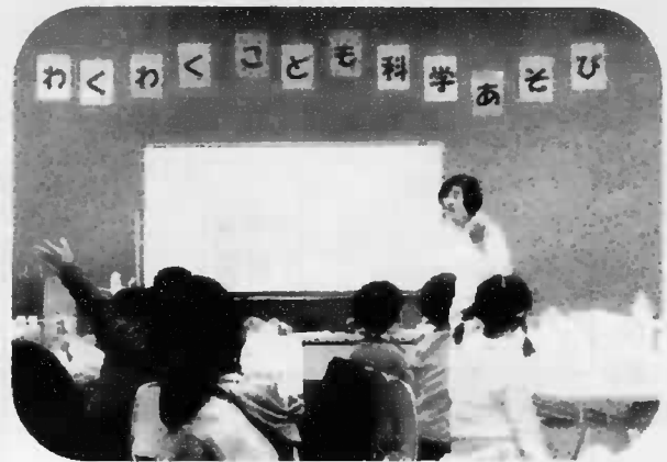
▲わくわく子ども科学あそび

粕谷区民センター運営協議会・粕谷児童館との三者共催行事はもとより、地域の皆様方、地域の小中学校と協力し地域に親しみやすい図書館運営をしていきますので、どうぞよろしくお願いたします。