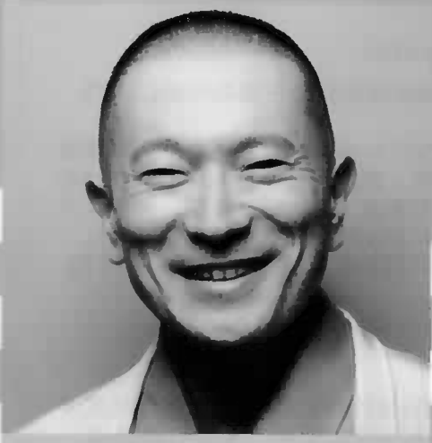
落語家 三遊亭竜楽