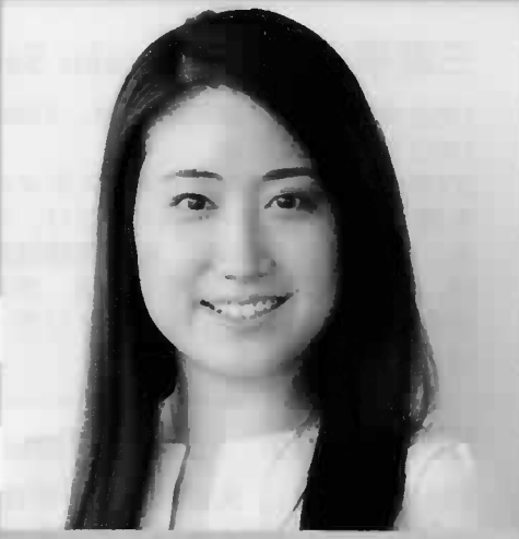
元新体操日本代表 田中 琴乃