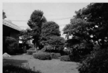
●成城四丁目発明の杜市民緑地