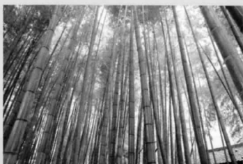
●喜多見五丁目竹山市民緑地