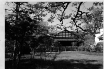
●大原一丁目柳澤の杜市民緑地

当財団では、屋敷林や雑木林などの民有地を、市民緑地や小さな森制度を活用しながら、 みどりの保全を進めています。皆さまからいただいた会費は、 このような環境を保全する費用として大切にさせていただきます。