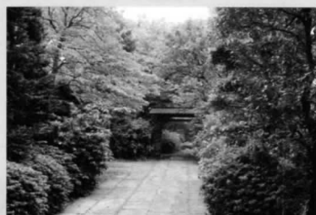
●北烏山九丁目屋敷林市民緑地